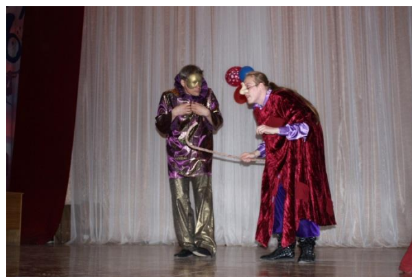
Драматерапия «Карлик Нос»