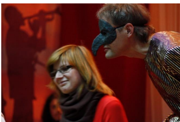
Перформанс «Сказки Христиана Андерсена»