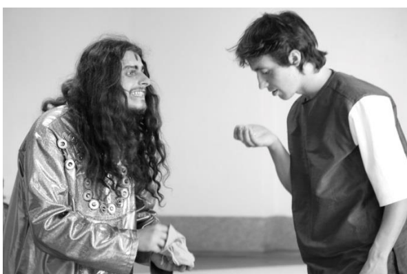
Драматерапия «Карлик Нос», спектакль по профилактике и психологической коррекции табакозависимости